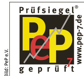
Abb. 2: Nur Software, die von der Zertifizierung BAU GmbH geprüft ist, d.h. PeP-7-regelkonform die Kennzahlen ermittelt, darf dieses Zertifizierungs-Siegel tragen und damit auch werben.

Planungsbüros bei der Bewältigung ihrer betriebswirtschaftlichen und unternehmerischen Anforderungen zu unterstützen, ist das Anliegen der Praxisinitiative erfolgreiches Planungsbüro e.V. (PeP). Die PeP-7-Kennzahlen sind die sieben besonders aussagefähigen und schnell zu ermittelnden Werte, die zur Grundausrüstung gehören müssen, wenn für das „Unternehmen Planungsbüro“ der Status und der künftige Kurs bestimmt werden sollen. Dies geht am besten mit entsprechender Software. | Clemens Schramm